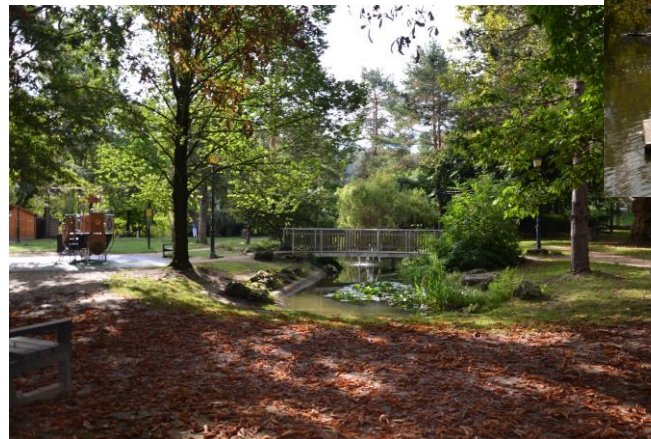
(3) Le jardin du Beach et les bords de Marne

Surnommée « la ville aux huit villages », elle est composée de plusieurs quartiers, dont le quartier de La Varenne-Saint-Hilaire. C'est au cœur de ce quartier très convoité que se trouvent nos appartements de la résidence « Anne-Marie », immeuble construit en 1905 que nous vous proposons entièrement rénovés, et éligible au régime du déficit foncier.