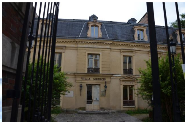
(1) La Villa Médicis

La résidence bénéficie d'un emplacement d'exception, à l'angle de l'avenue du Mesnil et de l'avenue du Bac. Cette rue animée propose un vaste choix de commerces de bouche, de restaurants et de boutiques ainsi que le cinéma historique 4 Delta situé à quelques pas de nos appartements.